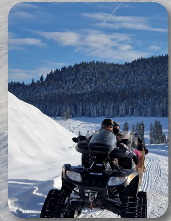
Ciaspole & motoslitta