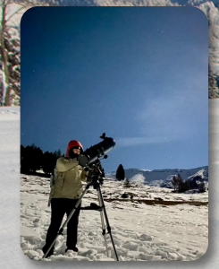
Escursioni con telescopio

Vivi una montagna di emozioni con ASIAGO GUIDE!