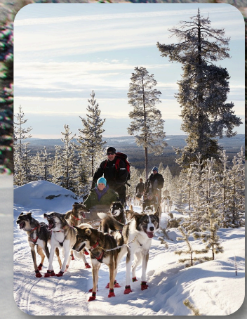
La magia dello Sled dog

Vivi una montagna di emozioni con ASIAGO GUIDE!